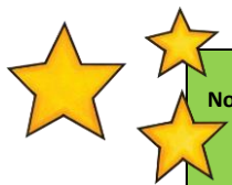
TABLEAU DE CORRESPONDANCE ENTRE LE NOMBRE D’ERREURS ET L’ÉCHELLE D’APPRÉCIATION POUR LA CORRECTION DE L’ORTHOGRAPHE